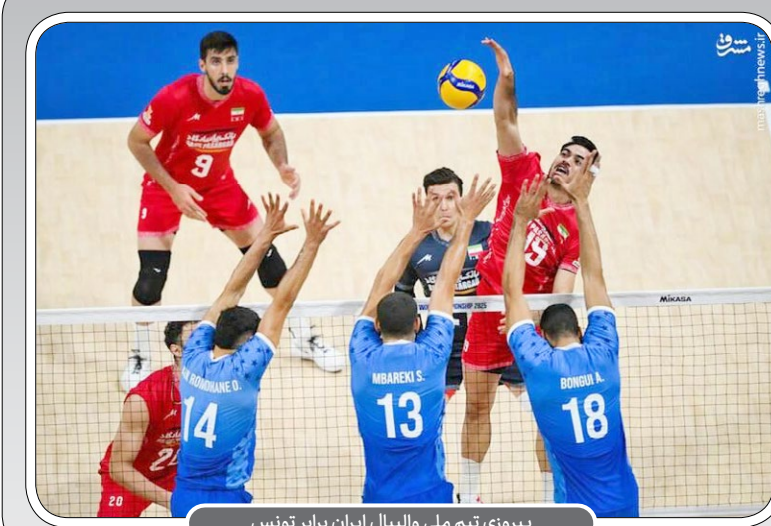
پیروزی تیم ملی والیبال ایران برابر تونس