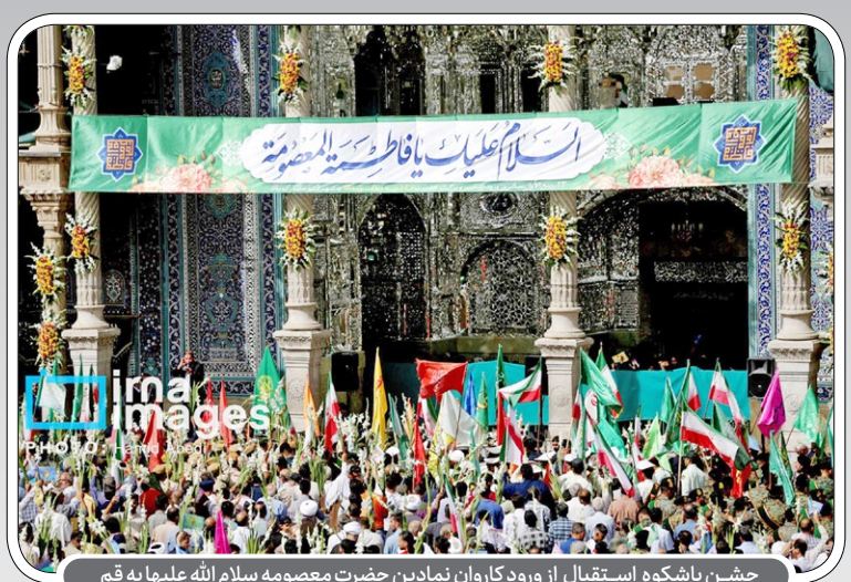
جشن باشکوه استقبال از ورود کاروان نمادین حضرت معصومه سلام الله علیها به قم